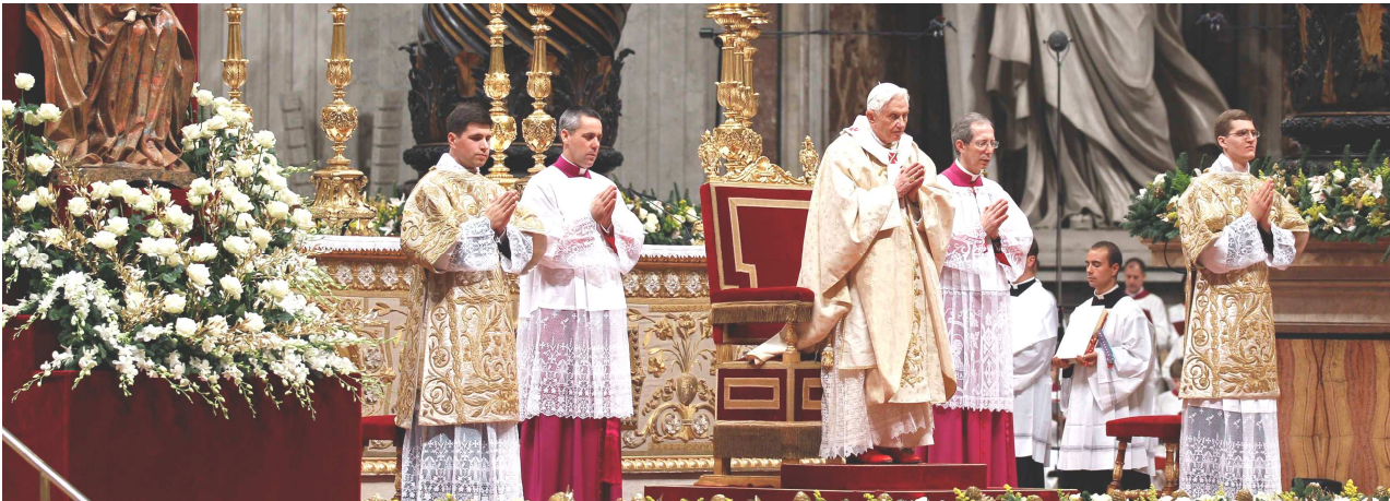
Unum Presbyterium – to share the one priesthood of Christ – Chrism Holy Mass in Vatican

വൻ വിജയങ്ങളുടെ പ്രകമ്പങ്ങളെക്കാൾ കടുകുമണിയുടെ ലാളിത്യമാണ് വിശുദ്ധാത്മാക്കളുടെ ചരിത്രത്തിൽ ക്രിസ്തു വെളിപ്പെടുത്തി തരുന്നത്. അത് ദൈവരാജ്യത്തിന്റെ രൂപവും ശൈലിയുമാണ് എന്നോർക്കണം. ക്രിസ്തുവിന്റെ ദാസന്മാരും ദൈവിക രഹസ്യങ്ങളുടെ കാര്യസ്ഥന്മാരുമാണ് വൈദികർ എന്നാണ് പൗലോസ് അപ്പസ്തോലൻ പറഞ്ഞിട്ടുള്ളത് (1കൊറി.4, 1). വൈദികർ അവരുടെ അജപാലന ശുശ്രൂഷയിലൂടെയും പ്രബോധനങ്ങളിലൂടെയും ക്രിസ്തുവിന്റെ മുഖവും ഹൃദയവും ലോകത്തിനു കാണിച്ചുകൊടുക്കുന്ന ദൈവിക രഹസ്യങ്ങളുടെ കാര്യസ്ഥന്മാരാകണം. ഇന്ന് ലോകത്ത് ഏറെ മതാത്മകമായ അജ്ഞതയുണ്ട് എന്നത് വലിയ സത്യമാണ്. വിശ്വാസത്തെ സ്നേഹിച്ചുകൊണ്ട് അതിൽ ജീവിക്കുകയാണ് നാം ദൈവത്തെ സ്നേഹിക്കുകയും അവിടുത്തെ ശ്രവിക്കുകയും ചെയ്യേണ്ടത്.